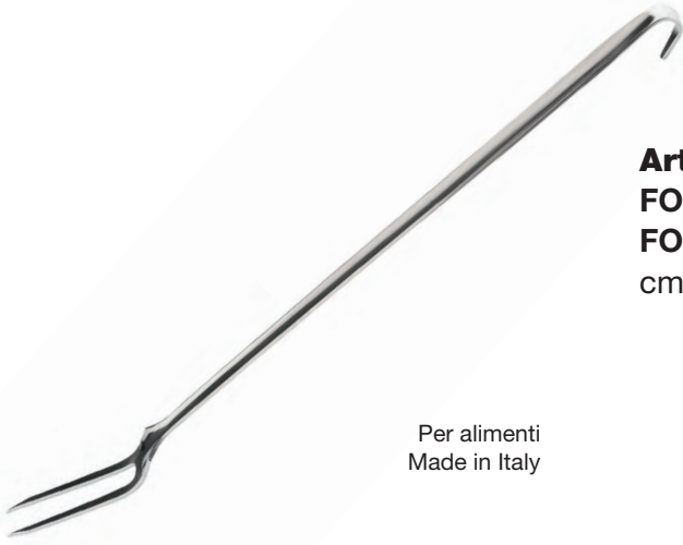
Art. A146 - Inox 18/10 - AISI 304 FORCHETTONE 2 PUNTE FORK 2 TEETH cm. 54x37 - Spessore 3,7 mm.