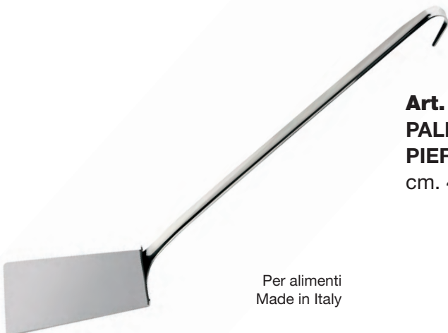
Art. A145 - Inox 18/10 - AISI 304 PALETTA LASAGNA cm. 12 PIERCED LASAGNA cm. 12 cm. 49x11,7