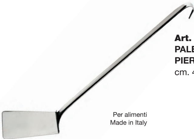
Art. A144 - Inox 18/10 - AISI 304 PALETTA LASAGNA cm. 10 PIERCED LASAGNA cm. 10 cm. 47x9,5