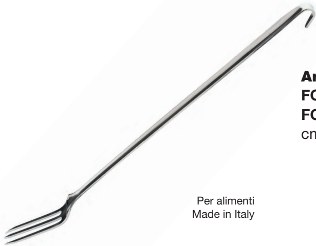
Art. A147 - Inox 18/10 - AISI 304 FORCHETTONE 3 PUNTE FORK 3 TEETH cm. 54x37 - Spessore 3,7 mm.